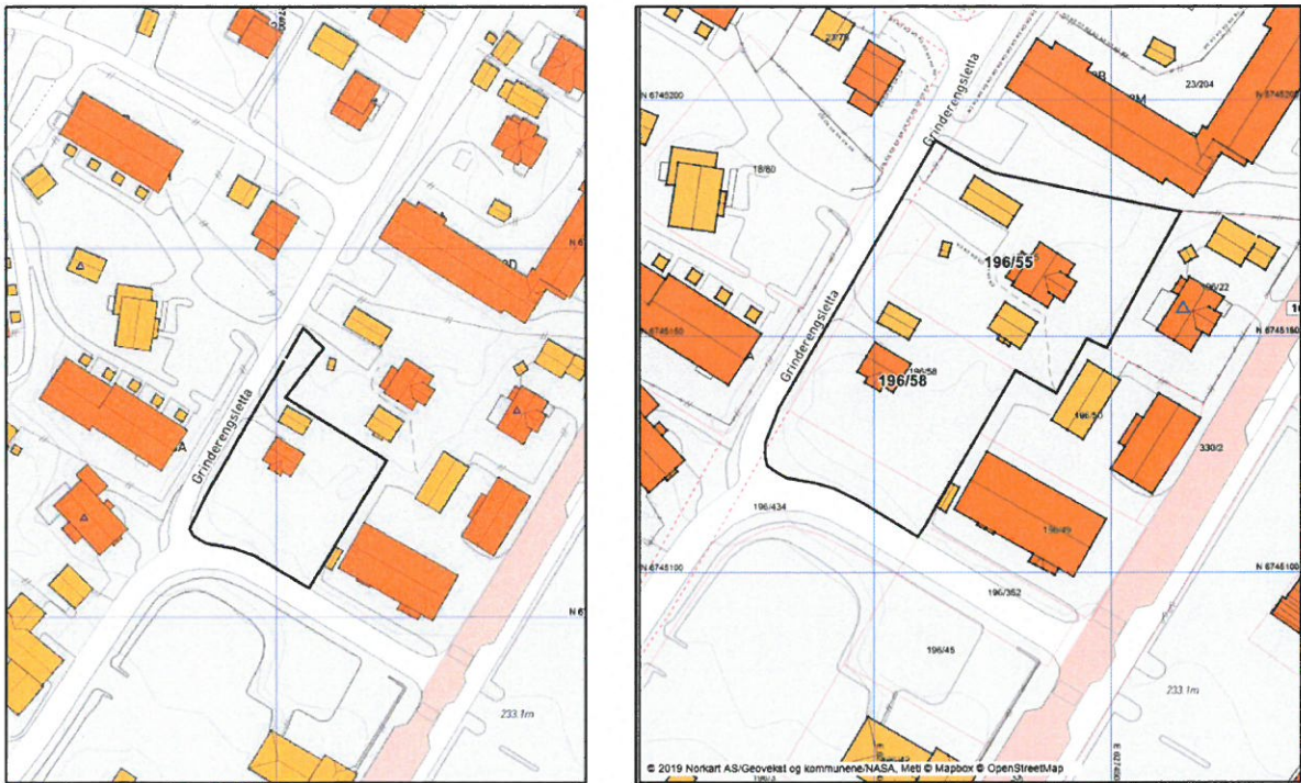
Figur 2. Kartutsnitt til venstre viser opprinnelig planavgrensning. Kartutsnitt til høyre viser ny planavgrensning

Planområdet, som ligger langs vegen Grinderengsletta i Løten sentrum, er med utvidelsen av naboeiendommen på ca. 3,2 daa. Planområdet består av gnr. 196, bnr. 55 og 58, samt en mindre del av gnr. 196, bnr. 434.